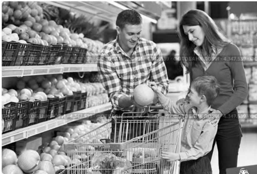
Семья выбирает продукты в супермаркете